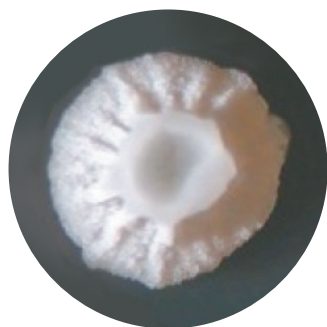
バチルス サブチルス C-3102株